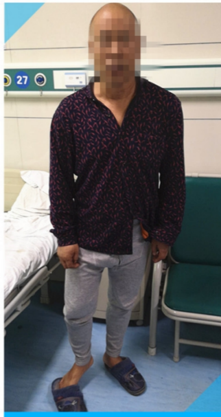
患者四肢恢复运动功能