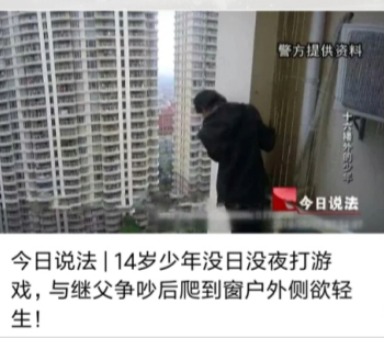
今日说法 | 14岁少年没日没夜打游戏，与继父争吵后爬到窗外侧欲轻生！

胸痛中心的认证成功是荣誉，更是责任，胸痛中心的建设，只有开始，没有结束。本次独立开展冠状动脉造影术+冠脉支架植入术是胸痛中心建设成果的有力展示，也是良好的开端。济仁人将不忘初心，继续砥砺前行，用规范化运作，为郿邑区胸痛患者的健康保驾护航。