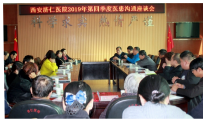
西安济仁医院2019年第四季度医患沟通座谈会

为了不断提高我院的医疗技术水平和服务质量，满足广大患者的实际需求，为每位患者提供更加优质的诊疗服务，更好地服务广大人民群众，使每位患者早日康复，我院于2019年12月3日召开了每季度一次的医患沟通座谈会，旨在听取广大患者的心声，为我们今后的工作提供改进依据。