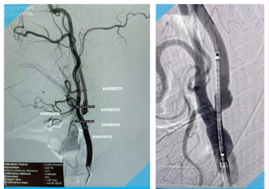
支架前，颅内动脉瘤狭窄 2019.07.25 支架植入，血流恢复 2019.07.25